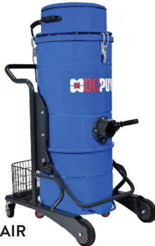
W 3 AIR

DU-PUY manufactures Air operated vacuums to suck up powders, liquids and solids. These machines are suitable for environments where an electric power source is non-existent or considered as dangerous.